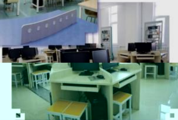
一体化课程教学设计综合实训室