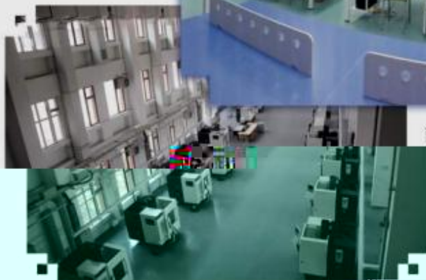
DMG 数控技术训练场所